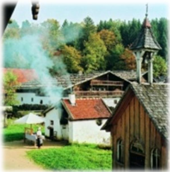
Museumsdorf Bayerischer Wald

Fragen Sie einfach an der Kasse der teilnehmenden Einrichtungen oder in den Tourist-Infos nach den Ermäßigungen!